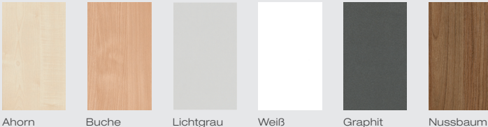
Ahorn Buche Lichtgrau Weiß Graphit Nussbaum