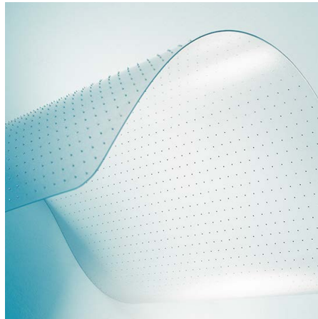
Für Teppichböden mit Ankernoppen